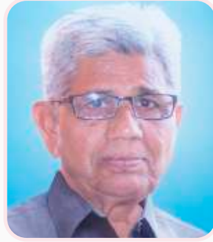
कै. प्रा. बी. के. परदेशी प्राणीशास्त्र विभाग