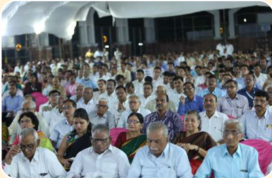
खान्देश कॉलेज एज्युकेशन सोसायटीच्या अमृत महोत्सवी प्रकट कार्यक्रमाचा आनंद घेतांना प्रेक्षकगण