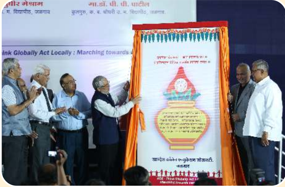
खान्देश कॉलेज एज्युकेशन सोसायटीच्या अमृत महोत्सवी कार्यक्रमात अमृत कलशाचे अनावरण करतांना सन्माननीय मान्यवर