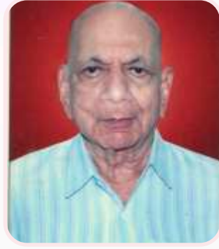
कै. प्रा. मो. स. भावे अर्थशास्त्र विभाग