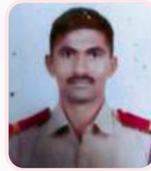
JUO. Vijay Poste All India Thal Sainik Camp 2019 Silver Medal in Health & Hygiene