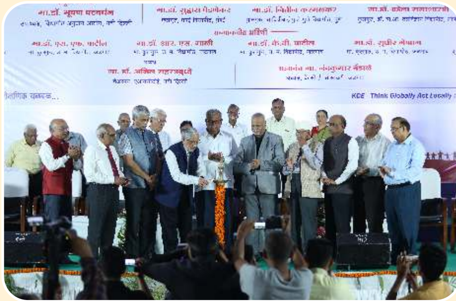
खानदेश कॉलेज एज्युकेशन सोसायटीच्या अमृत महोत्सवी प्रकट कार्यक्रमाचे उद्घाटन करतांना मान्यवर