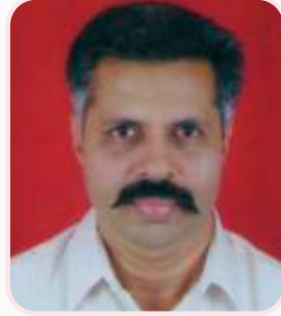
प्रा. जे.एस. व्ही. आर. कृष्णप्रसाद गणित विभाग